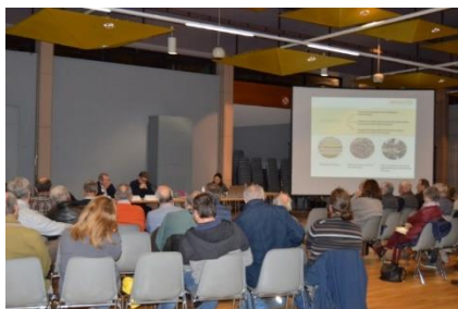
Réunion publique le 28 novembre 2022 au Centre Culturel et de Congrès de Paray-le-Monial

les personnes publiques associées (les services déconcentrés de l'Etat dont la DDT 9 , les services de la région Bourgogne-Franche-Comté, les services du département de Saône-et-Loire, les chambres consulaires) et les citoyens a été respectée. Pour informer le public, une réunion publique a été organisée à Paray-le-Monial, afin de présenter les propositions des élus et les discuter avec le public pour les faire évoluer.